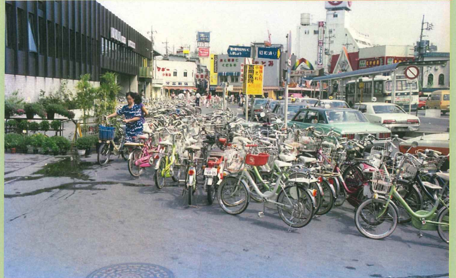
昭和53年9月21日撮影の日本国有鉄道小岩駅南口（現JR小岩駅）。当時は、自転車が駅前に多数駐輪されていました。